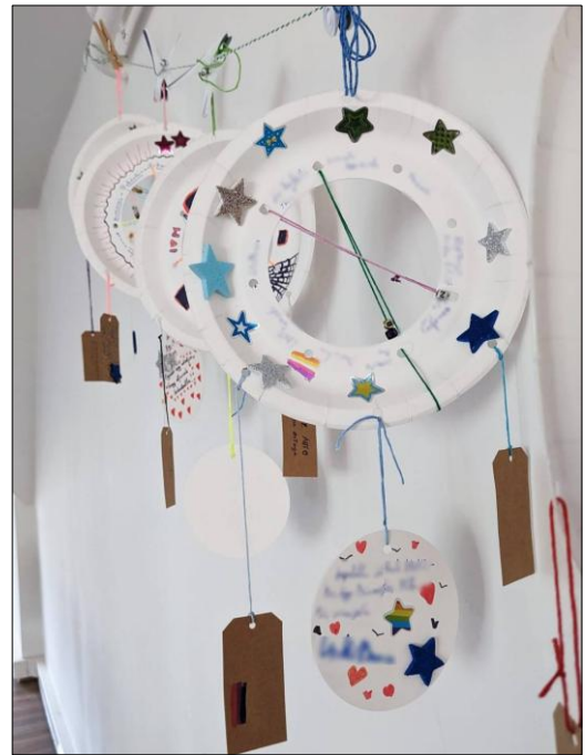
Jedes 'Dream Nest' begleitete seine(n) Young Expert mit nach Hause.

Zum Abschluss schenkten alle Fachkräfte und Young Experts einander «Sparks», d.h. Funken bzw. Elemente, welche Kraft und Energie vermitteln können. Diese waren z.B.: Musik, der eigene Wille, Vorbild sein, 'Power Nap', Liebe, Mutter und Freunde, Geschwister, Erfolge der Jugendlichen, die Familie, der Glaube, Zufriedenheit mit dem Leben, die eigene Lebensphilosophie, die jungen Menschen im Heim.