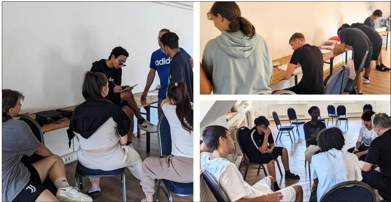
Young Experts: «Wir haben viel Wissen, mit dem wir helfen und etwas verändern können.»

sein, wenn man wisse, was man wolle. Durch ihre Vergangenheit seien sie reifer geworden; sie hätten viele Erfahrungen aus ihrer Vergangenheit, die ihnen helfen, ihre Zukunft aufzubauen. Sie seien fest entschlossen.