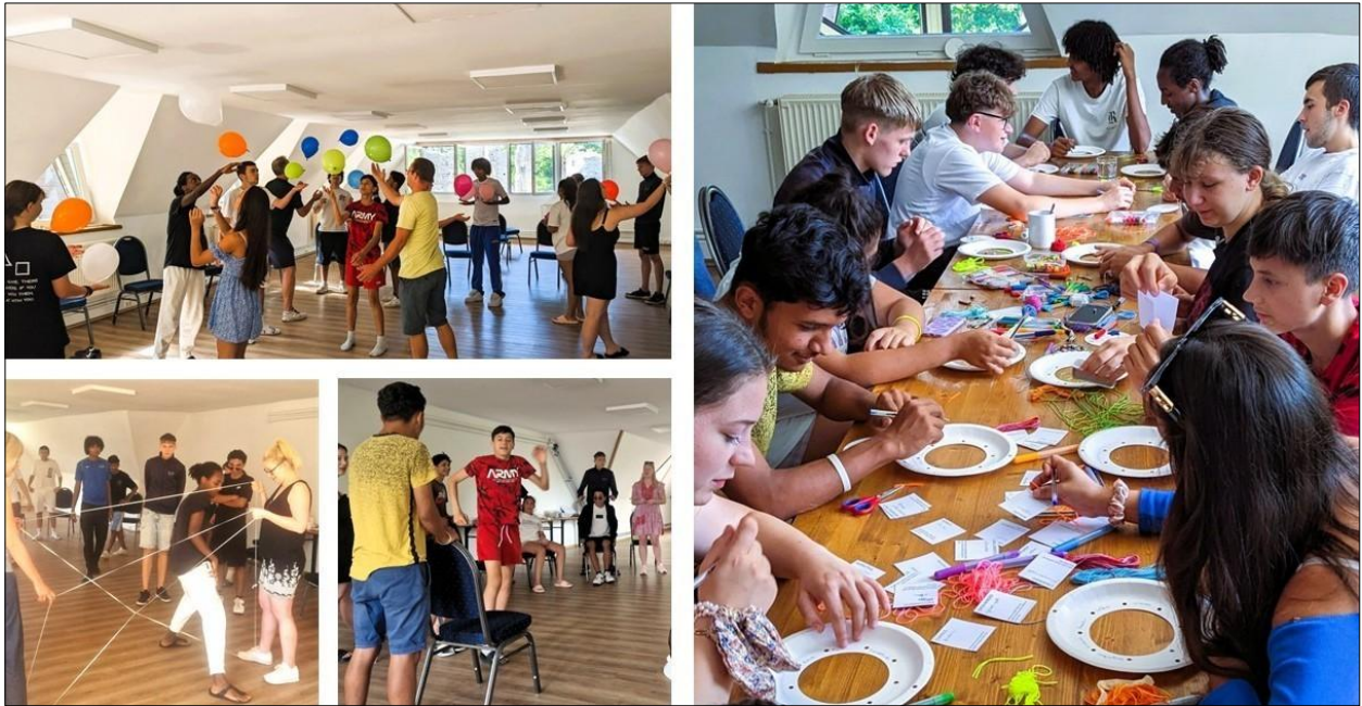
Kreative Zusammenarbeit der Young Experts

Wie bei allen Creating Futures-Aktivitäten umfasste die Arbeitsweise die vier Ways of Working : Partizipation, Zusammenarbeit als „Community of Practice“, Fokus auf Lernen und Befähigung sowie Fokus auf Organisations- und Qualitätsentwicklung. Es wurden verschiedene Workshops und Reflexionsrunden sowie viele spielerische und kreative Arbeitsformate genutzt.